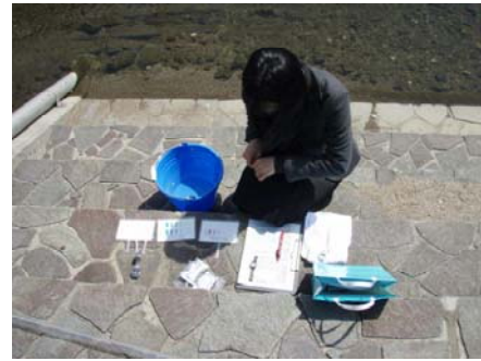
〈実際の水質調査時の様子〉

甲府河川国道事務所はYamanashiみずネットと協働で、水質や水辺の環境を調査する機会をつくり、その結果をまとめたマップづくりを続けています。