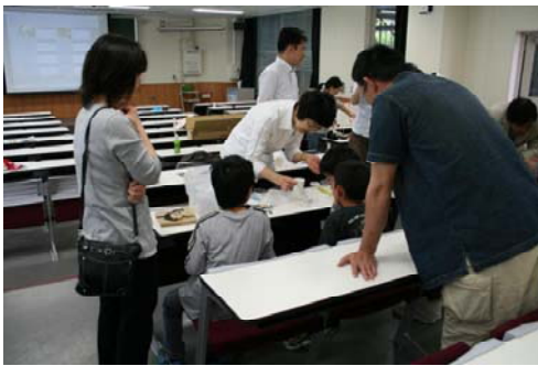
〈水質調査練習会の様子〉