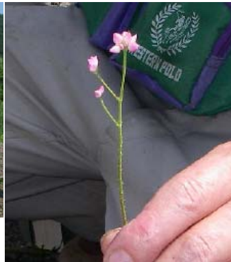
アキノウサギツカミ