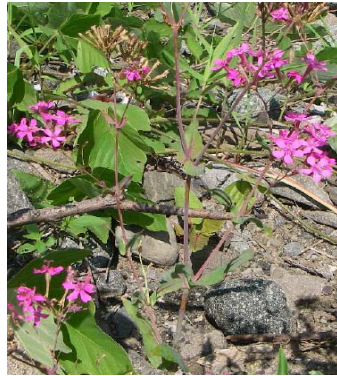
ムシトリナデシコ