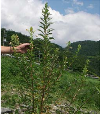
アレチマツヨイグサ