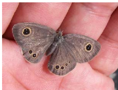
ヒメウラナミジャノメ