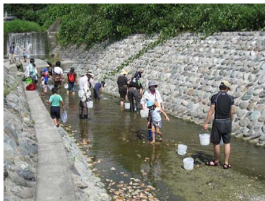
・探検のようす(魚類・底生動物)