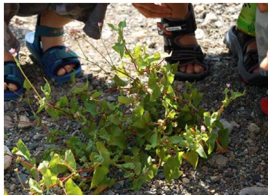
ウナギツカミ(植物)