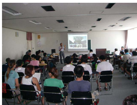
・観察された生物を解説していただきました。 (身延町総合会館)