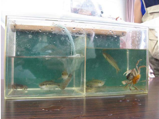
アブラハヤやサワガニ