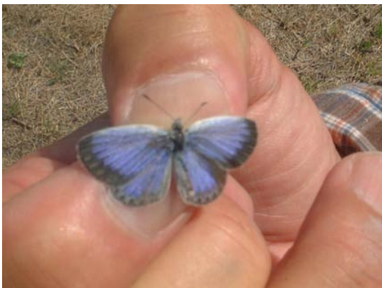
ヤマトシジミ(蝶類)