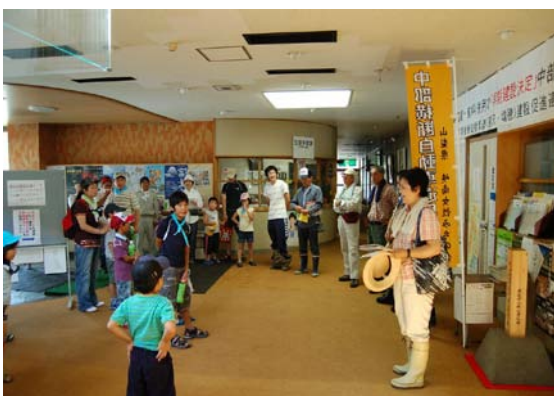
・これから探検に出発です！