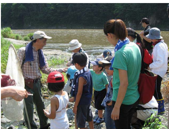
・探検のようす(蝶類)