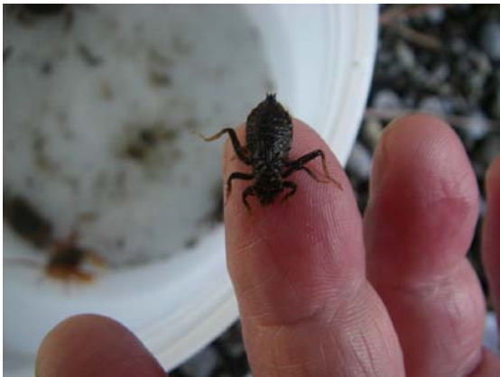
サナエトンボのヤゴ(底生動物)