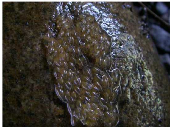
カワヨシノボリの卵