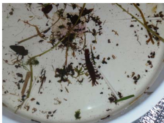
ヘビトンボ、カワナなど