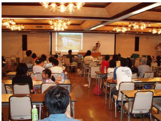
指導員による解説