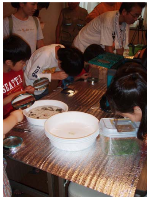
実体顕微鏡や虫メガネで底生動物を観察