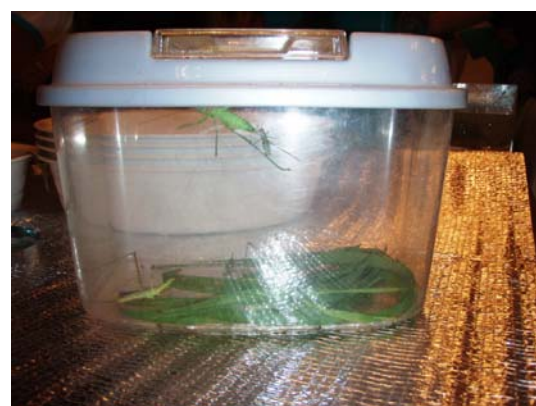
ショウリョウバッタ