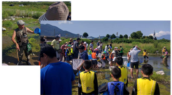
観察の方法をおしえてもらい、探検開始！！