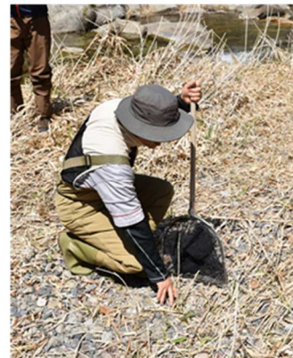
生き物のつかまえ方を 教えてもらいました